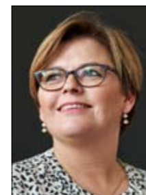
Af Marianne Vind Medlem af Europa-Parlamentet

Nu sker det: I sommer overtog Danmark EU-formandskabet. Her fra min plads i EU-Parlamentet kan jeg mærke forventningerne. Der er lidt af samme stemning, som da jeg som barn skulle på lejrskole. Man ved, det bliver stort, men man kender ikke alle overraskelserne endnu.