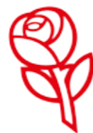
Peter Hummelgaard til "Grill en Minister".

Ankersminde festival 2024 er et klart bevis på, at når DSU og hele arbejderbevægelsens ungdom står sammen, er vi stærkere end nogensinde før. Solidaritet og sammenhold er ikke blot ord, men noget, der føles og leves.