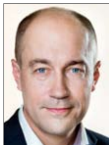
Af Magnus Heunicke Miljø- og ligestillingsminister