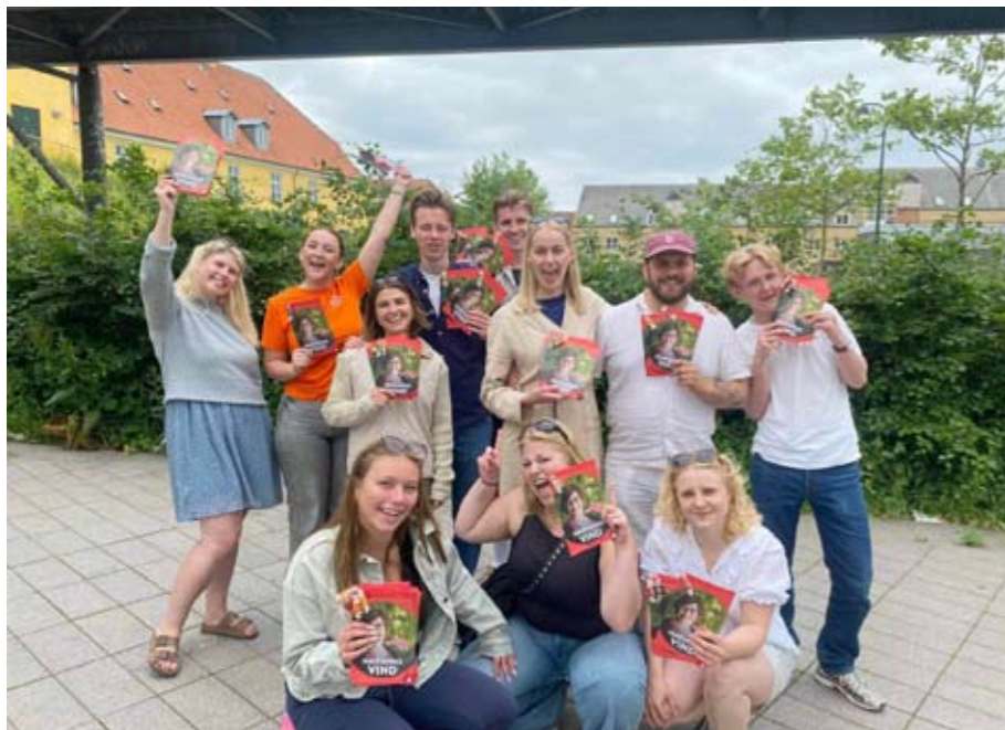
Kampagnedag i Næstved mandag den 3. juni med skolebesøg på EUC-Sjælland og Absalon, dør-til-dør i ungdoms- og ældreboliger og stationskampagne ved Næstved Station.