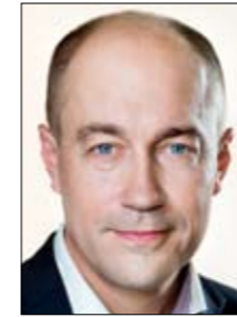
Af Magnus Heunicke Miljøminister

Sagen om Nordic Waste og jordskredet med forurenede jord er blevet et anliggende for hele Danmark. Det handler om en potentiel miljøkatastrofe på flere forskellige planer, og så er det blevet et spørgsmål om ansvar og moral.