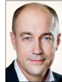
Af Magnus Heunicke Miljøminister

Rigtig meget i vores samfund handler om at komme hurtigst muligt fra A til B. I økonomien, uddannelse, den kollektive transport og så videre. Men når vi taler om vores vandløb, er opgaven den modsatte. Åer og bække skal gerne snørkle sig gennem landskabet for på den måde at skabe bedre betingelser for naturen. For fisk og smådyr i åerne og landskabet omkring dem. Derfor er vi i gang med at genoprette slyngninger, udlægge sten, fjerner spærringer så fisk og smådyr kan vandre frit vandløbene og beskytte områderne omkring åerne.