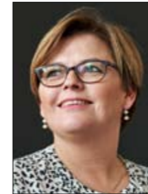
Af Marianne Vind Medlem af Europa-Parlamentet