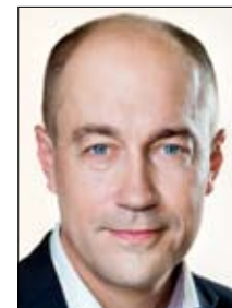
Af Magnus Heunicke Miljøminister

Danske virksomheder importerer spildevand, der indeholder olie, og trækker olien ud af vandet, så den kan genanvendes. Olien i spildevandet er en ressource, og danske virksomheder er dygtige til at udvinde olien og rense vandet.