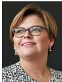
Af Marianne Vind Medlem af Europa-Parlamentet