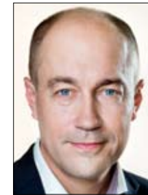
Af Magnus Heunicke Miljøminister

Jeg er i politik for at gøre en indsats for noget, der er større end mig selv. For at gøre en forskel for alle. Selvom det var vemodigt at sige farvel til de mange dygtige folk i Sundhedsministeriet, så føles det helt rigtigt, at jeg nu har fået ansvaret for at passe godt på vores miljø og natur.